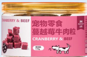
蔓越莓牛肉粒(犬用)