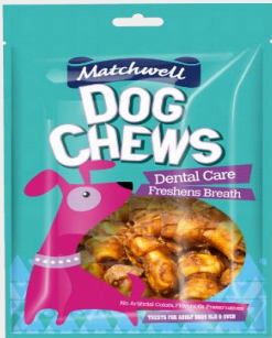
鸡肉酱磨牙结骨(113克)