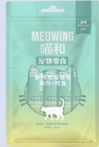
喵和鸡肉+鳕鱼猫条