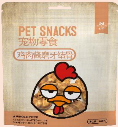
线上款鸡肉酱磨牙结骨