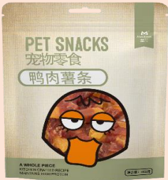
线上款薯条缠鸭肉