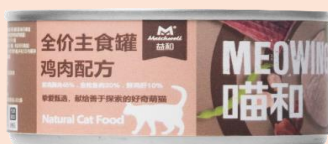
喵和全价鸡肉主食罐