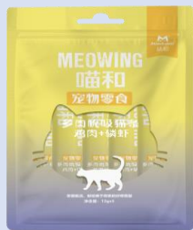
喵和鸡肉+磷虾猫条