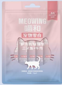
喵和三文鱼+牛肉猫条