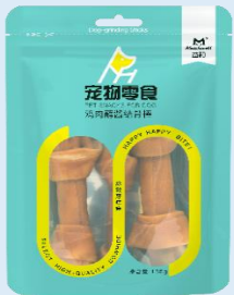
鸡肉蘸酱结骨棒 (135克)