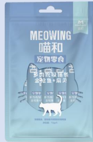
喵和金枪鱼+扇贝猫条